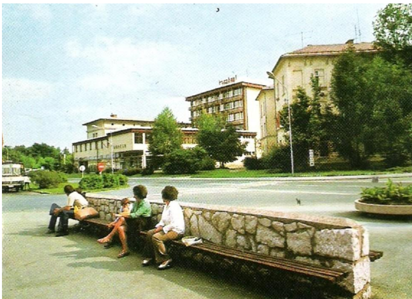
Znamenita kloпка pred pošto - neuradni podaljšek AP, 1984