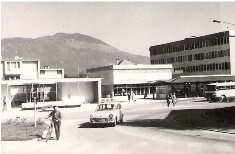
Izvoz z Avtobusne postaje v Radovljici, pred 1970