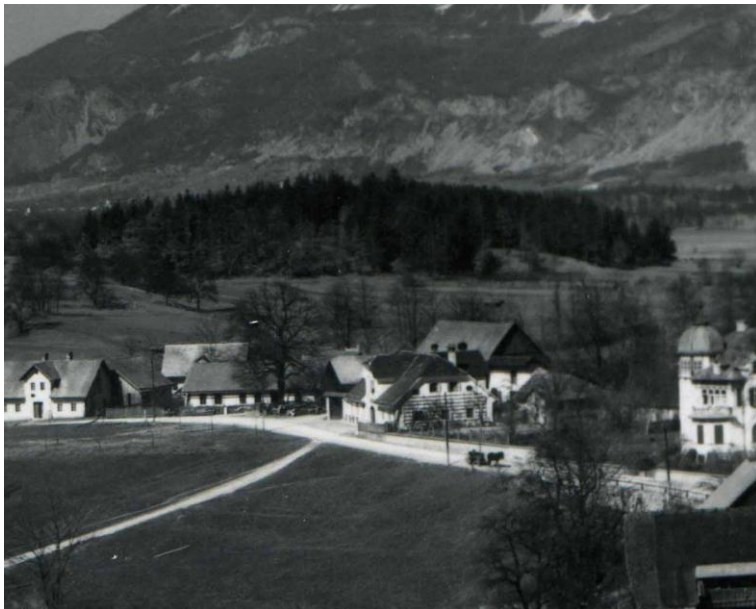
Stičišče glavne in lokalne ceste pred gostilno Hiršman, ok. 1935

Od Sokolskega doma je šla cesta nato po današnji trasi naprej v Lesce. Druga povezava s Kropo pa verjetno ob obzidju grajskega parka (takrat je bila meja obzidja na mestu, kjer je danes hotel Grajski dvor), mimo gostilne Kosmač, skozi stari del mesta, preko železniškega mostu proti Kropi.