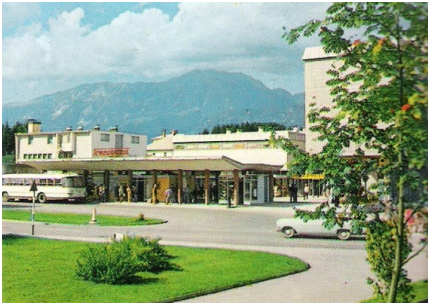
Avtobusna postaja Radovljica

Radovljiška avtobusna postaja v osemdesetih