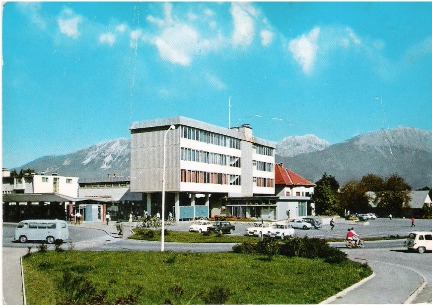
Parkirišče in Avtobusna postaja v Radovljici