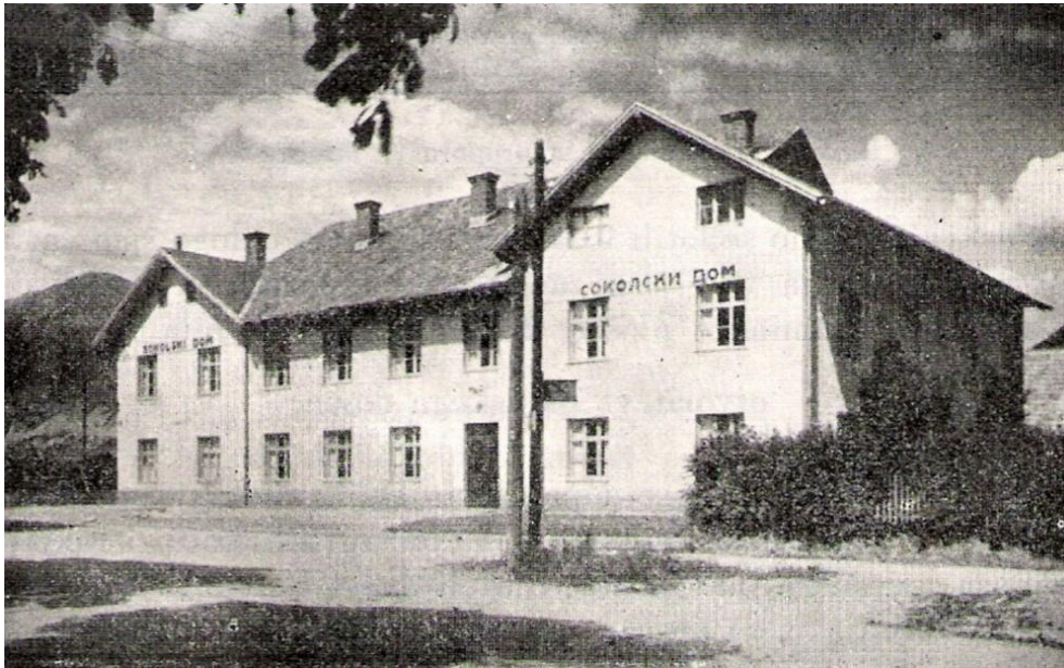
Sokolski dom - prvo znano avtobusno postajališče, ok. 1930

Cesta v letih 1933-1953. Ob gradnji hotela Grajski dvor so tudi spremenili traso ceste. Ta je še vedno šla skozi Predtrg, le da tokrat ni šla mimo Marolta, ampak so zgradili novo traso mimo hotela Grajski dvor , kjer so po letu 1934 ustavljali tudi avtobusi.