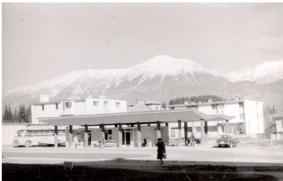
Avtobusna postaja v Radovljici, pred 1965