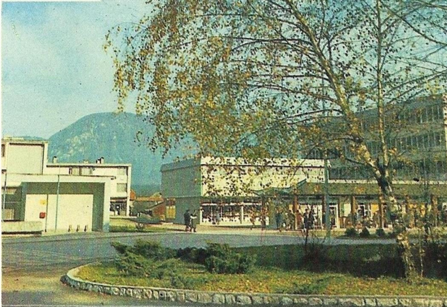
Avtobusna postaja v Radovljici, ok. 1965