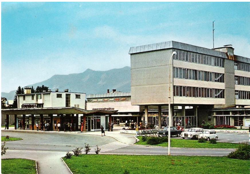
Avtobusna postaja v Radovljici