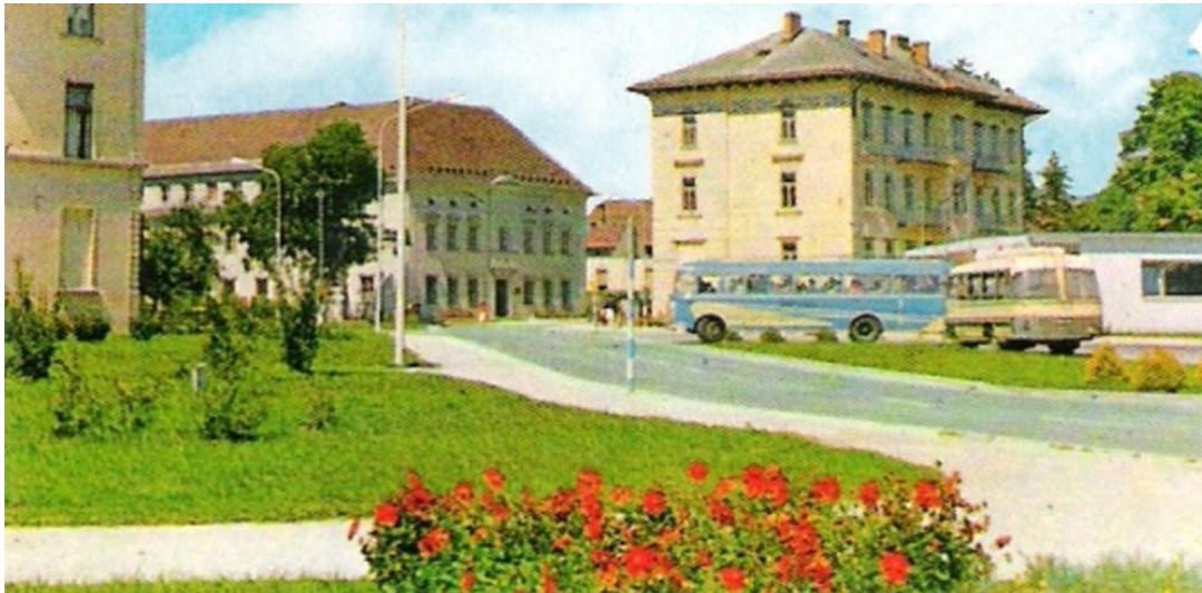
Izvoz z Avtobusne postaje, ok. 1965